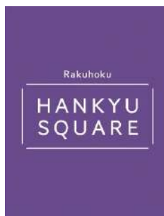
洛北阪急スクエアロゴ