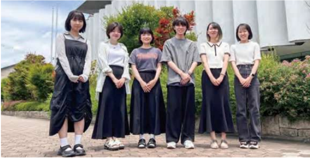
表紙のイラストを担当した京都美術工芸大学の学生

「3回生有志6人でコンペを行いました。採用案は、どの世代の方にも楽しんで見てもらうことを意識し、明るく温かみのある色彩でまとめました。特に鴨川などの自然の豊かさ、電車やバスの利便性、大学などの環境面を表現しました。」