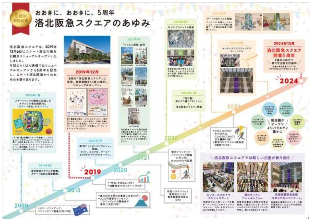
洛北阪急スクエアのあゆみ

2000年11月、スケートリンクの跡地に前身であるカナート洛北が開業。洛北阪急スクエアは、2019年12月6日にカナート洛北の後を引継ぎリニューアルオープンいたしました。今回のらくはん通信ではリニューアルオープンから5周年を記念し、カナート洛北開業からのあゆみを振り返ります。