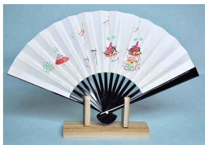
とくの「手描き茶席扇子 祇園祭」 4,400円