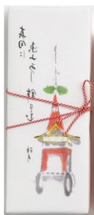
俵屋吉富「おくちどり」 (煎餅2枚、落雁3個、琥珀糖3個、 押物2枚、糖玉20g) 1,404円