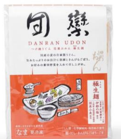
名代おめん「団樂おめん極生麺」 4食入送料込・クール便 4,500円