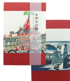
表現社「御朱印帳 京の風景」 1,650円