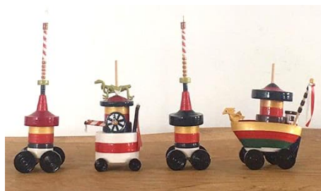
雀休「京こま 祇園山鉾」(左から) 長刀鉾 3,850円、蟻螂山 5,500円、 月鉾 3,850円、船鉾 5,500円