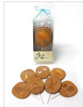
むかし菓子本舗 「うちわせんべい」 560円