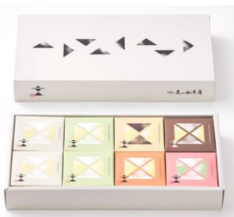
文の助茶屋「わらび餅 8個詰合せ・ ギフト(すいか)」 3,888円