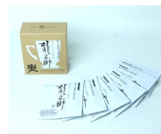
前田珈琲「4種のドリップ パックギフトセット」4,990円