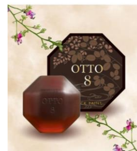
BLACK PAINT「OTTO」 (120g) 2,750円