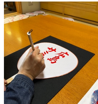
職人が丁寧に名前を書き入れる