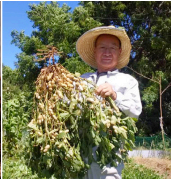
一口目から神崎落花生の力強い味わいに驚かされるチーズケーキ