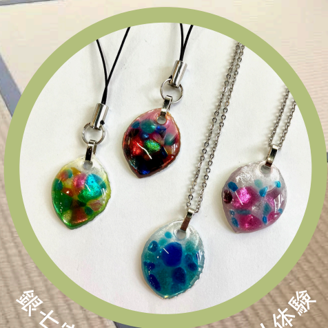
銀土宝アクセサリー作り体験