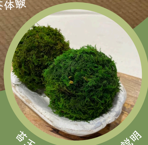
苔玉作り体験とお庭の説明

【会場】文化と産業の交流拠点(仮称)-旧富岡鉄斎邸- 京都市上京区室町通一条下ル薬屋町429 (上京中学校東側)